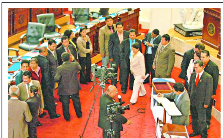
Diputados firmando el Libro de la Vida en el recinto

En el Salón Azul de la Asamblea Legislativa, Monseñor Fernando Sáenz Lacalle apoyó esta iniciativa, y se dirigió a la honorable Asamblea de la República explicando el valor de