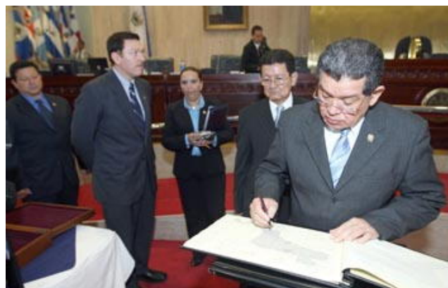
El Presidente de la Asamblea diputado Rubén Orellana firmando el libro, que fuera rubricado por todos los legisladores salvadoreños

Desde El Salvador el libro siguió viaje hacia Guatemala con 207 rúbricas de legisladores, y se espera que el documento sea rubricado por todos los congresos de Centroamérica. Las siguientes escalas serán Nicaragua y Costa Rica, pero algunos legisladores ya proponen que se incluya también a Panamá y México.